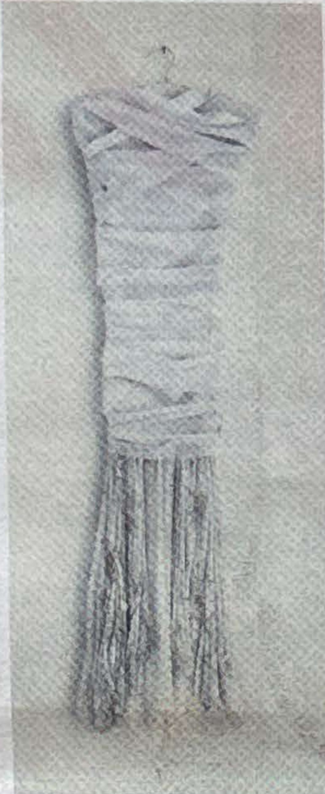
"תכריכים", 2022

ציור נוסף שקשור לנישואים הוא "כלואה". אקטע מצוירת כשהיא לבושה בשמלת "התשובך לולו" מטקס החינה התימני. "הציור מצויר בגודל טבעי ונראה כמו סרקופג, מומיה. הוא משקף את התחושה שהייתי כלואה בתוך דפוס התנהגות ודפוס חשיבה מסורתיים בתוך זוגיות, זה ציור שגם מזכיר את סבת, שחותנה בגיל 12 עם סבא שלי שהיה בן 28".