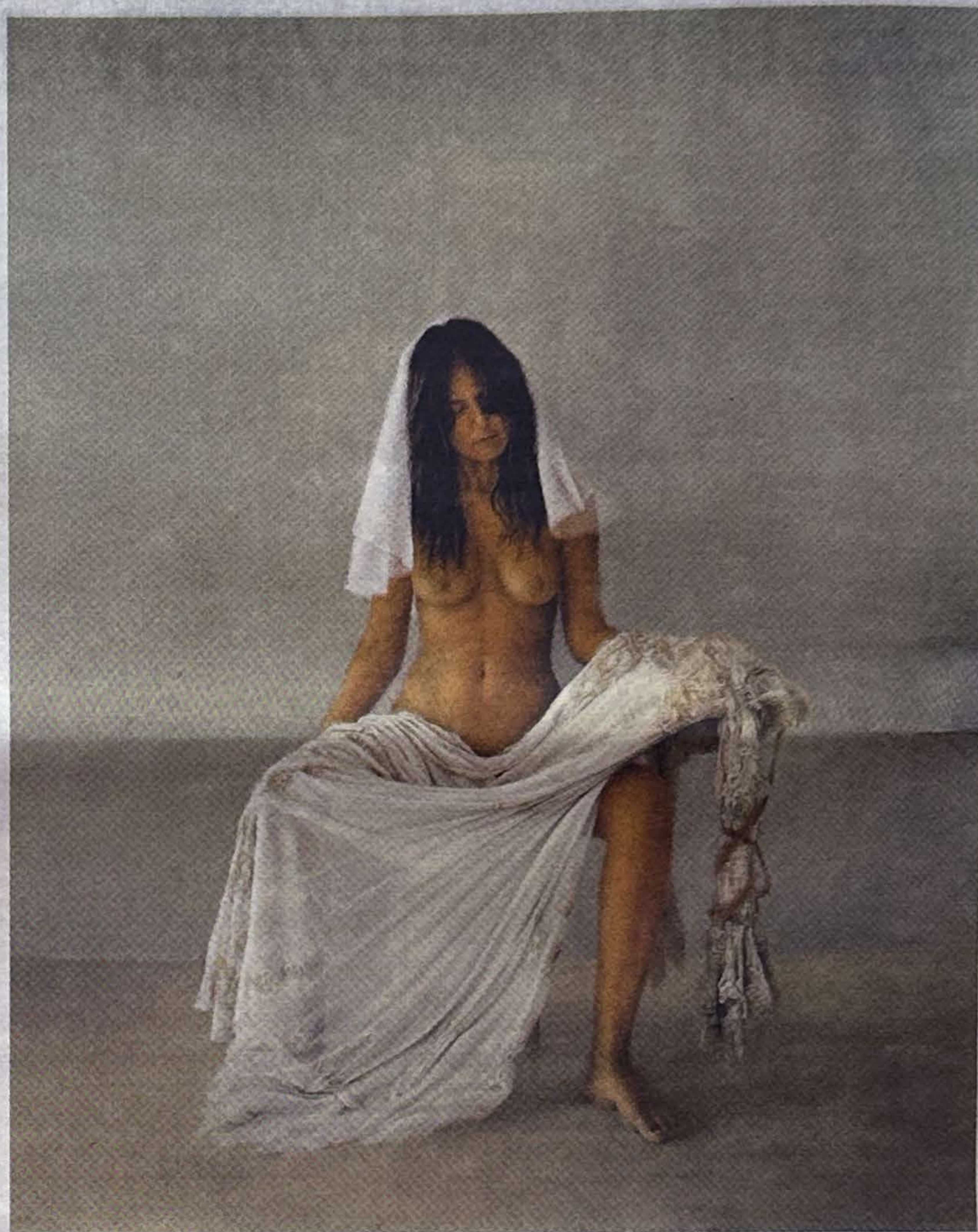
"פייטה", 2021. מריה המבכה את מות הנישואים

לדבריה, למרות שציורים ריאליסטיים ופיגורטיביים הפכו לפופולריים בשנים האחרונות, היא לא מוכרת בקלות. "אני לא מצוירת ריאליסטי בשביל למכור. גם הנושאים שלי מאוד קשים. אלה