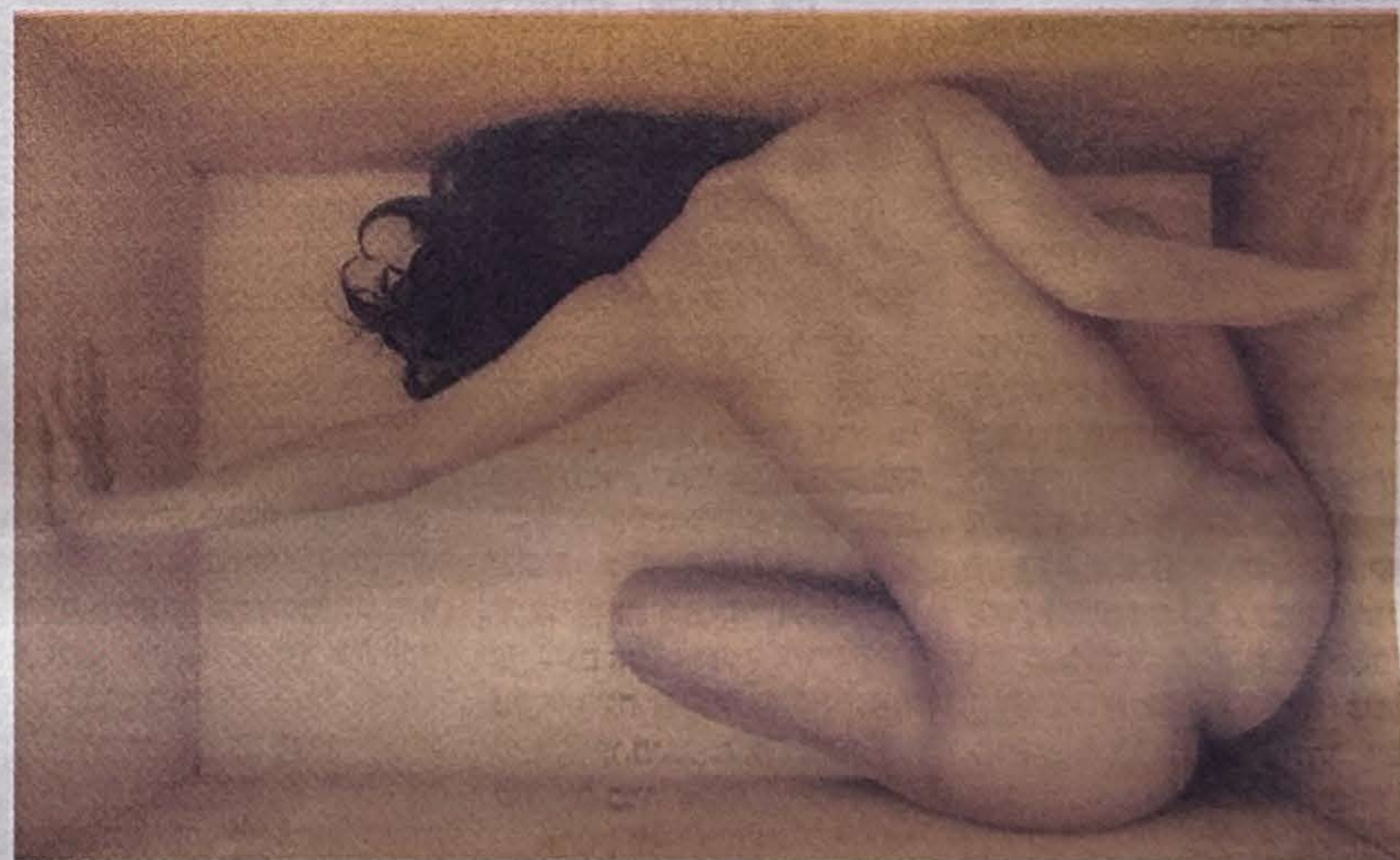
ללא כותרת, 2010. "חזרתי כל הזמן למקום הלא טוב"