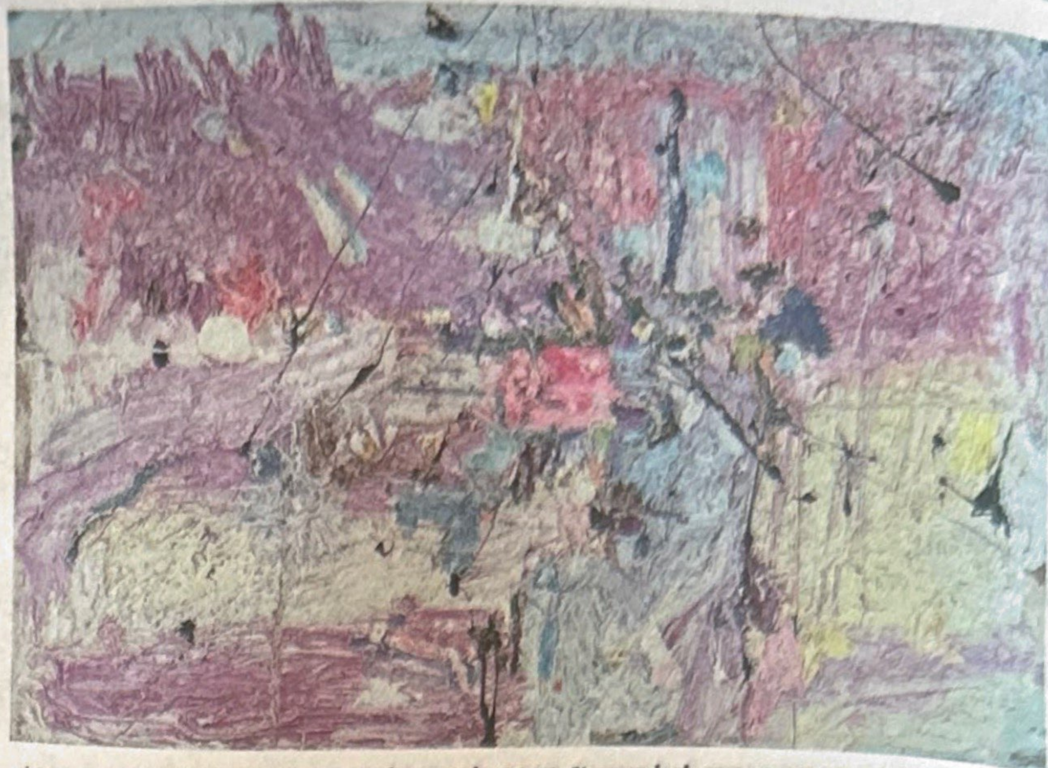
סבתא, גשר איירי וסיוור צבאי בדרך לאל בורייג", 2017. לפוצץ ולחרב את שכבות הצבע