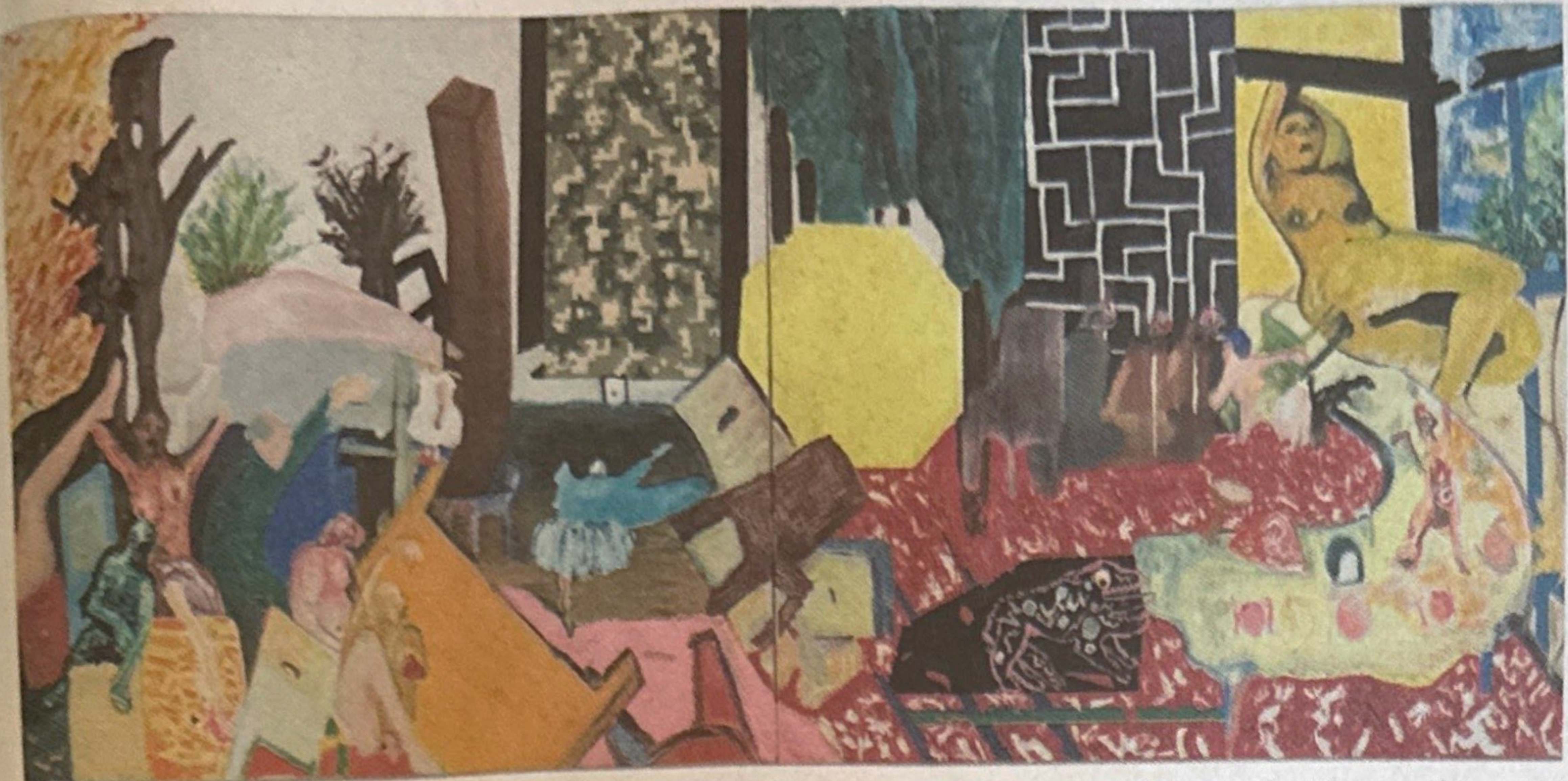
"חדר אוכל", 2014. "כאילו כפיתי על המציאות משהו ביזארי"