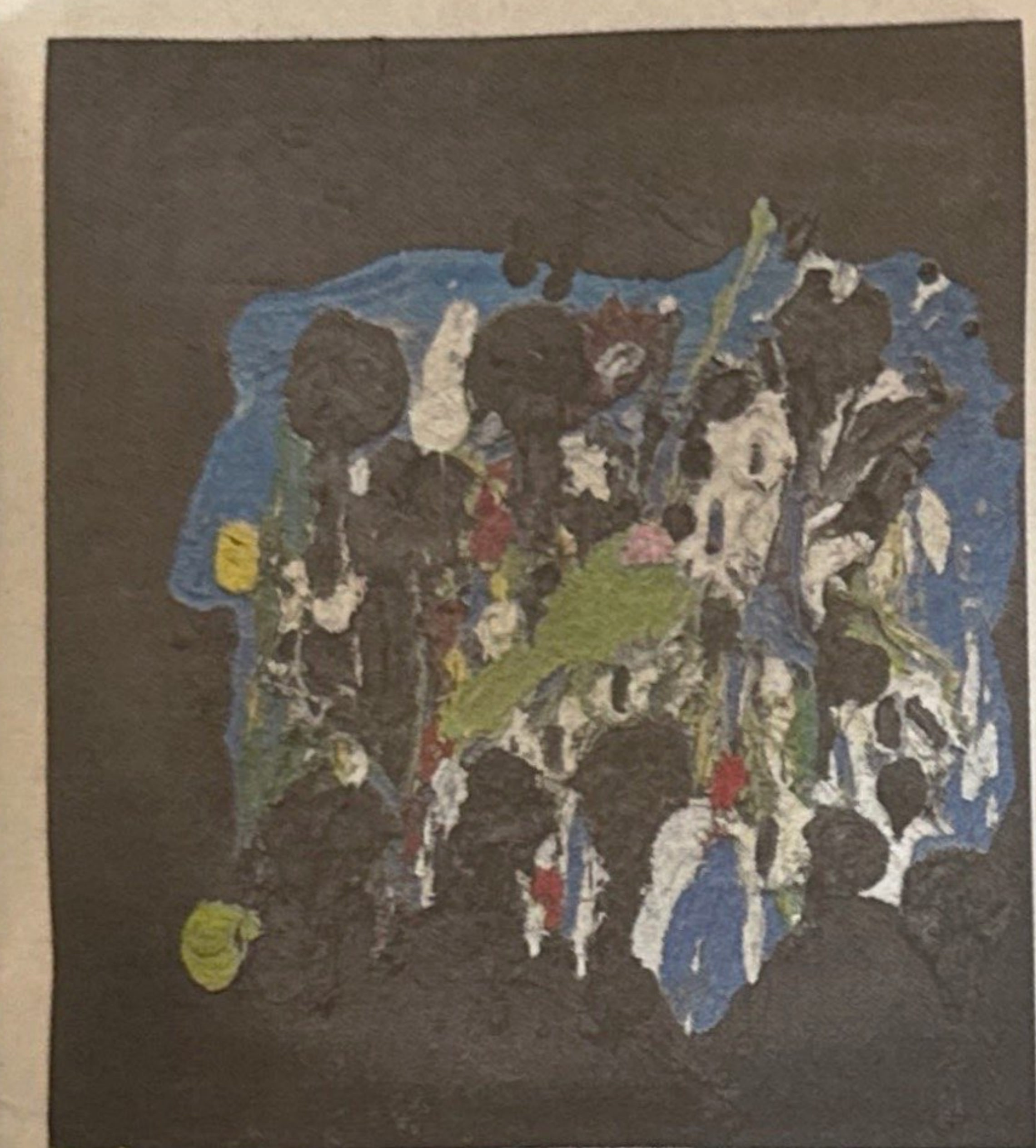
"הצילו", 2023. "מתקשה עכשיו לדמיין ציור חרדה"

מה יש לציור להגיד עכשיו, "כל תזוזה של פוך, כל נביחה של כלב, זה מוות. הוא שכב לידנו ולא זז, ואני מרגיש שזהו. עוד שנייה גומרים עלינו. התחלתי להיפרד מאנשים בוואטסאפ" בקומה השנייה של "ארטרט" בתל אביב, נדמה תלוש. "בארי זה הבית. זה מקום מדהים ומוגן ויפה – ככה הרגשתי עד לפני חודש, בכל אופן. כפרואר כולם מגיעים לראות את הכלניות ואתה רץ שם בשדות ומכיר כל חבר קיבוץ וכל אבן ויש תמיד קולות צחוק של ילדים והדשא תמיד ירוק. אבל יש איזה דיסוננס בין הפסטורליות הזו, לבין הפחד שאתה מרגיש שמב- בע, כי אחת לכמה חודשים משהו מתלקח ופתאום יורים עליך ויש טילים והרעש של המטוסים נכנס לך לתוך המוח. זה כמו מחבת עם חמאה, שתוססת בתוכו לאט לאט. אני חושב שדרך ציור של הנוף אני מרגיש, או הרגשתי, שאפשר לה- ביץ את זה. הנוף פאקינג זו. קורה בו משהו. זה דבר מקריפ שמעסיק אותי, בטח בתור אבא לילדים. אלה תנועות ממש עדינות של פחד וחרדה שמבעבעות כל הזמן מתחת לפני השטח, ואותן אני מנסה לצייר את הדיאלוג הזה, את הפער הזה בין מה שמתקיים בשכבות הצבע העליונות, לבין התנועה התת-קרקעית של החרדה שזוחלת מתחת. הציורים מאפשרים לי גם למצוא איזה מזור לפחדים שלי, לקחת את החרדה, לצייר אותה במים ופיגמנט, לשלוט בה איכשהו".